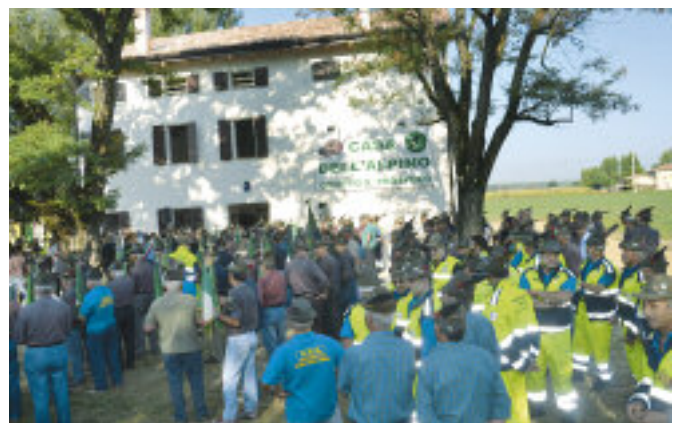
Penne nere durante l'inaugurazione della baita risistemata.

Per la sezione di Modena quello del dopo sisma è stato l'impegno più importante sul fronte della Protezione Civile e associativo a cui sia mai stata chiamata. Un impegno che si è chiuso proprio con il lavoro per la sede di San Prospero, per il quale Muzzarelli ha ringraziato in