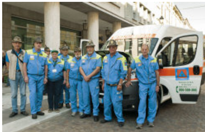
Il veicolo donato alla Protezione Civile della Sezione.