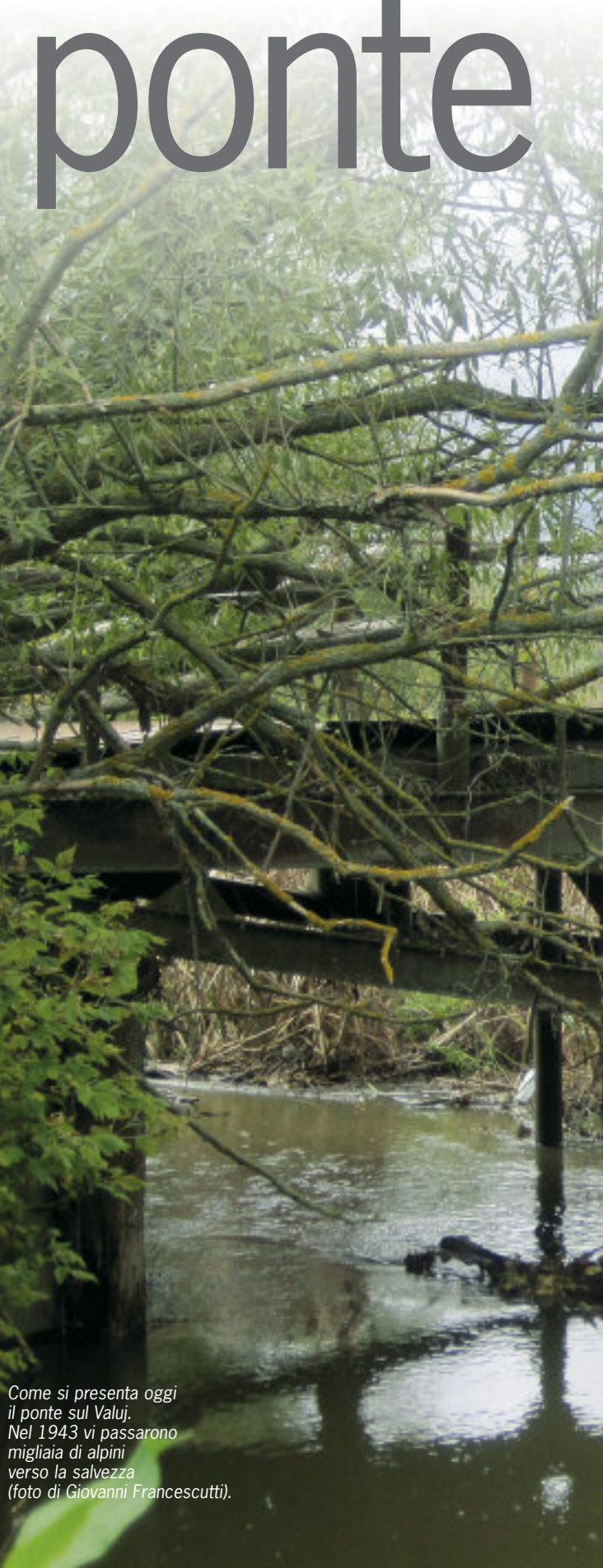
Come si presenta oggi il ponte sul Valuj. Nel 1943 vi passarono migliaia di alpini verso la salvezza.

Causale: contributo “Ponte degli Alpini per l'amicizia”