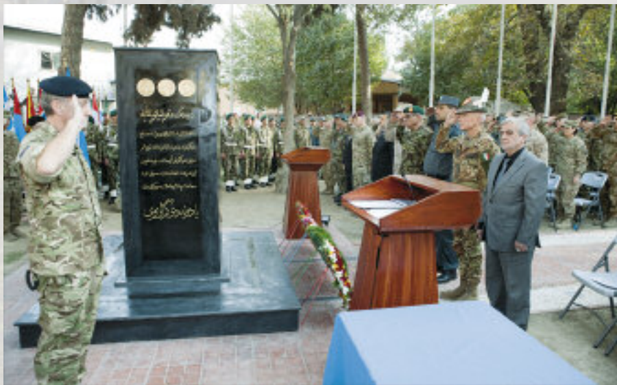
Il monumento, voluto dal gen. Battisti, dedicato ai Caduti afgani e dell'ISAF, all'interno del comando ISAF di Kabul, inaugurato alla presenza del comandante della missione ISAF, del Capo di Stato Maggiore della Difesa afgano e delle autorità civili locali.

La natura transnazionale di sfide importantissime per il futuro dell'area sembra essere stata recepita dalle differenti leadership della Regione. Un chiaro esempio è la recente visita del Presidente Karzai a Islamabad che ha portato un nuovo tono nelle relazioni Afghanistan - Pakistan, riducendo la carenza di fiducia tra i due Paesi. Tutto ciò rende ancora più chiaro, laddove ce ne fosse bisogno, che la soluzione politica è la chiave per una pace sostenibile, per la si-