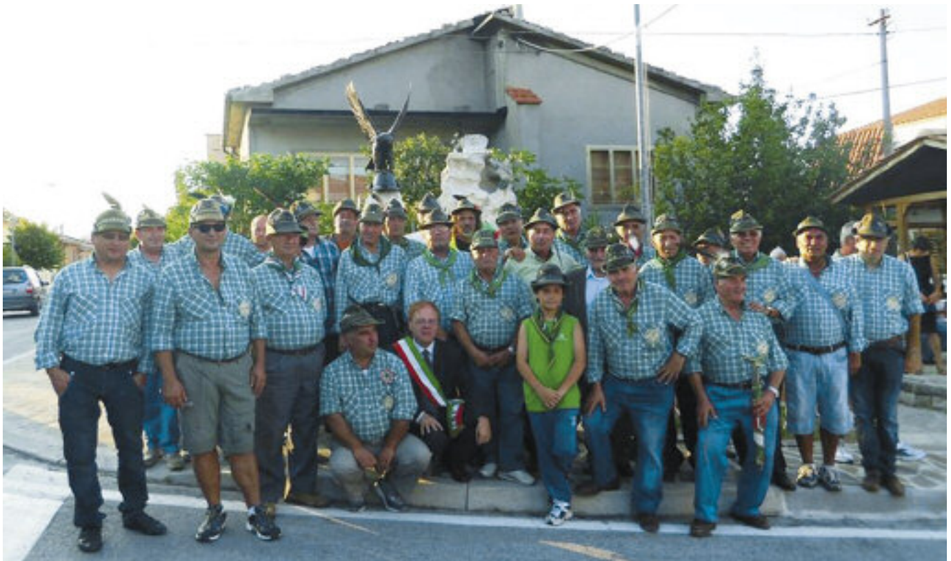
L'inaugurazione del monumento ai Caduti.

B orrello è un paese concentrato sulla sommità d'una collina di ottocento metri lungo la linea di confine fra l'Abruzzo e la provincia molisana di Isernia. Nonostante ciò ha tuttavia una propria dignità storica. Secondo il filosofo e storico della letteratura Benedetto Croce di questo borgo si ha testimonianza nell'anno Mille, si sa poi che divenne feudo dei nobili Borrello, dei quali prese il nome.