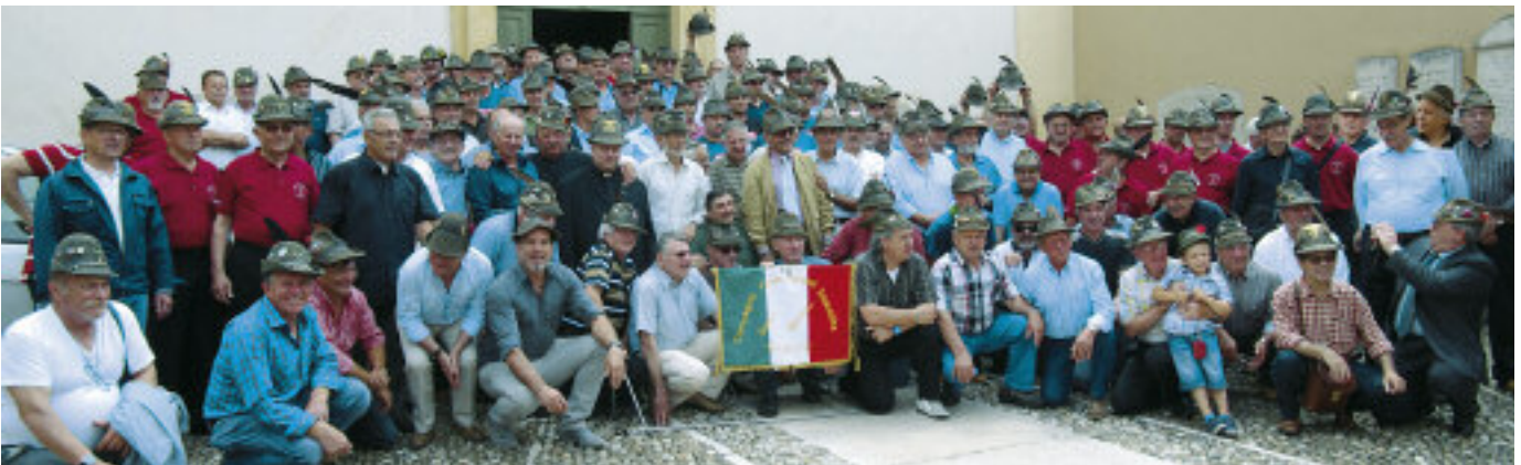
Circa 210 genieri alpini durante il quattordicesimo ritrovo a Borghetto sul Mincio della cp. genio Pionieri della Tridentina della caserma Vodice, con i gen. Pagano e La Plac.