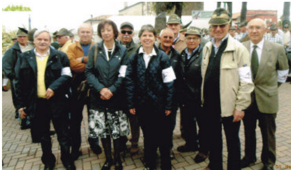
Il gruppo infermieristico di Bussolengo.

Perché gli uomini del fare sanno che le ciacole non fan farina e non c'è motivo per sprecarne. E si raccomanda: "Non metta il mio nome. A me interessa che funzioni il servizio. Non servono mie fotografie!". Forse ha ragione lui. Forse basterebbe dire che questo ambulatorio alpi-