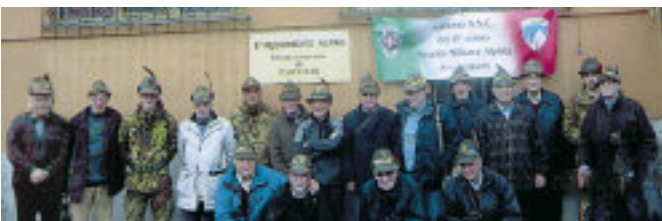
Raduno annuale a Tarvisio del 6° corso allievi sottufficiali di complemento ASC che negli anni 1954-55 erano alla SMALP di Aosta.