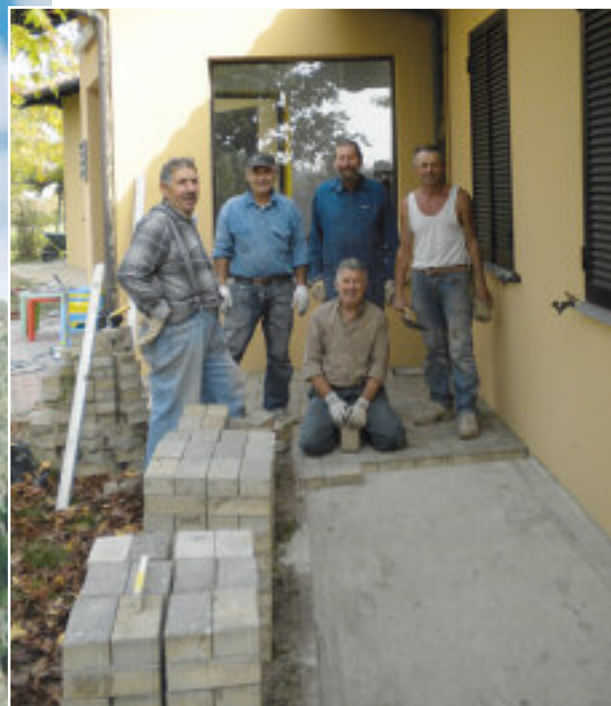
Gli alpini di Valle Cerrina sistemano i marciapiedi della scuola per diversamente abili.