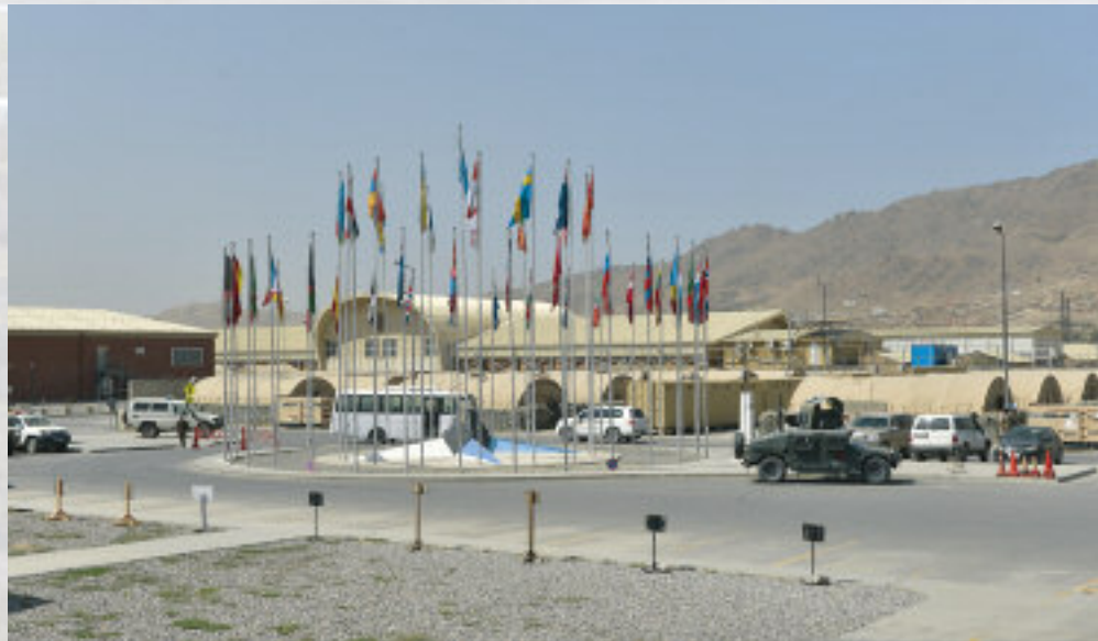
Il "Piazzale delle bandiere", nella parte militare dell'aeroporto di Kabul, che richiama l'ampia coalizione di Paesi che partecipano alla missione ISAF.