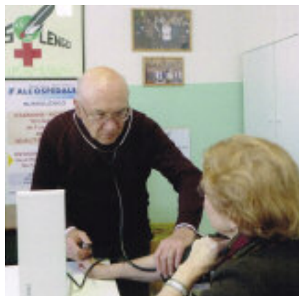
Controllo della pressione. Sopra: una panoramica di Civitate Camuno.

Uomini attaccati al territorio, alle tradizioni come le radici d’una pianta, nerborute e forti, lo sono alla terra. Ne avevano parlato alle riunioni del Gruppo, in